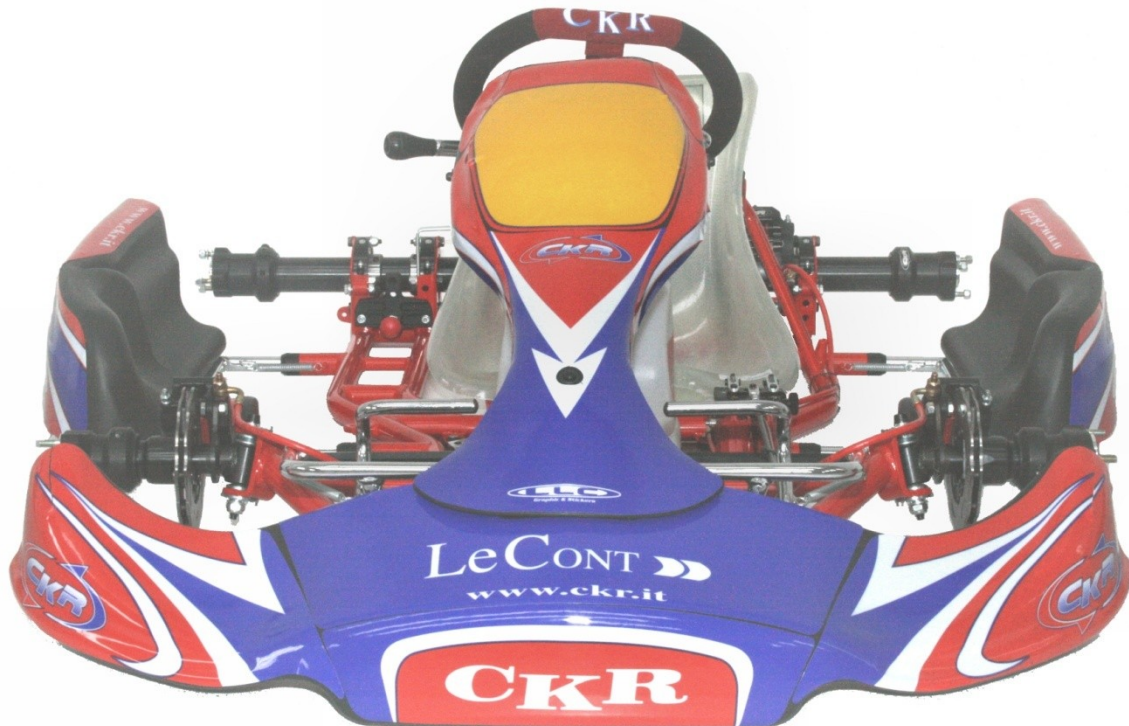
Foto frontale CKR SG2 2009

Sede operativa: Via dell'industria Conselve (PD) tel: +39 0429 719038 info@ckr.it